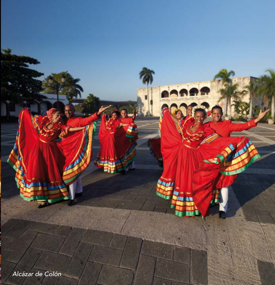
Alcázar de Colón

NOCHE LARGA DE LOS MUSEOS: Es un evento cultural que se lleva a cabo dos veces al año durante los meses de julio y diciembre, donde numerosos museos y otras instituciones culturales se abren al público de manera gratuita hasta altas horas de la noche. Además ofrecen conciertos, degustación de comida, música, bailes folclóricos, conferencias, teatro, entre otras actividades.