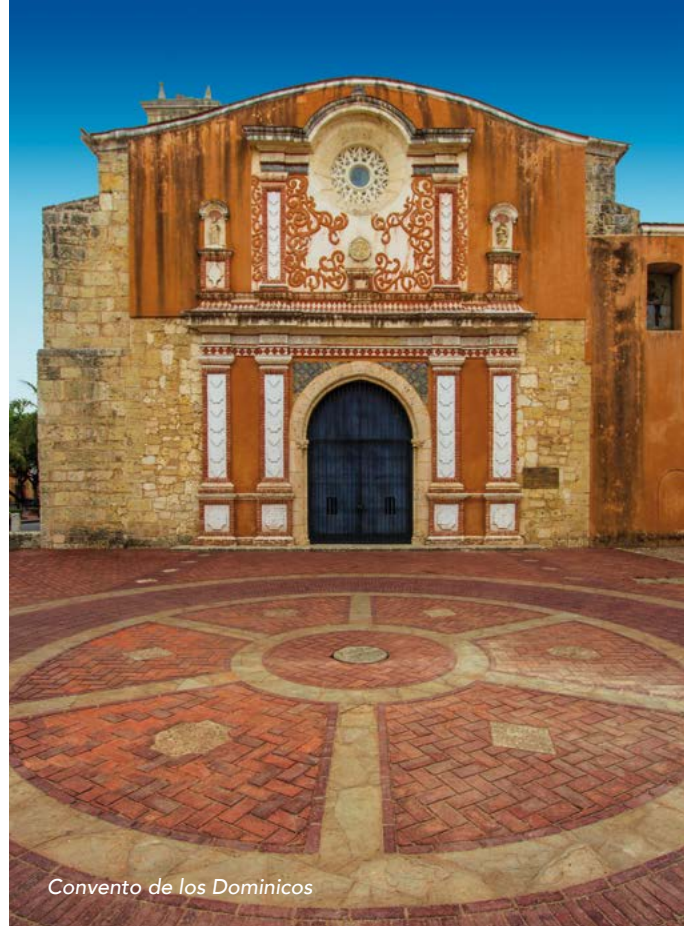
Convento de los Dominicos

THE COLONIAL GATE 4D CINEMA: En la experiencia multisensorial en 4D de “La batalla de Santo Domingo” podrás explorar la ciudad más antigua de América de una forma fascinante, divertida, emocionante y desde una perspectiva educativa. Disponible en 9 idiomas. Abierto de martes a domingo, de 10:00 a.m. a 11:00 p.m. www.thecolonialgate.com