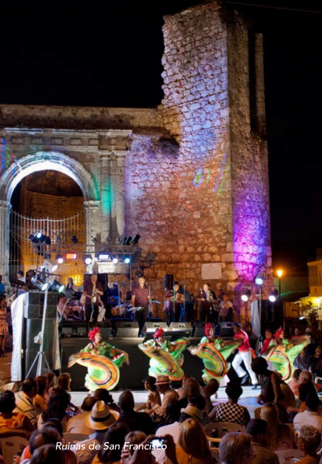
Ruinas de San Francisco