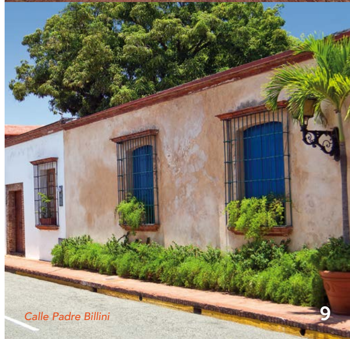
Calle Padre Billini